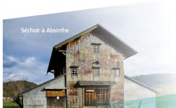
Séchoir à Absinthe

© 2015 - Crédits photos : Ville de Pontarlier / Guillaume Perret route de l'absinthe - Impression : Imprimerie Marie Pontarlier